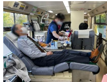
機器事業部での集団献血

なお、本社・本店での長年にわたる献血活動への貢献実績が評価され、令和6年度「献血功労 銀粋支部長感謝状」を贈呈されました。役職員による活動を表彰という形で評価いただき、大変光栄に存じております。