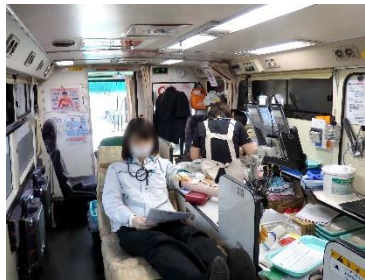
大阪支社での集団献血