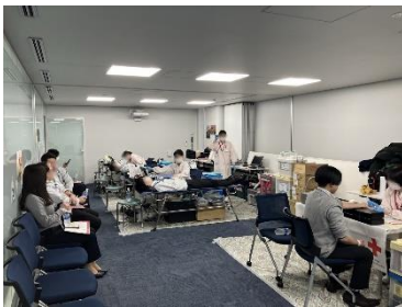
本社・本店での集団献血