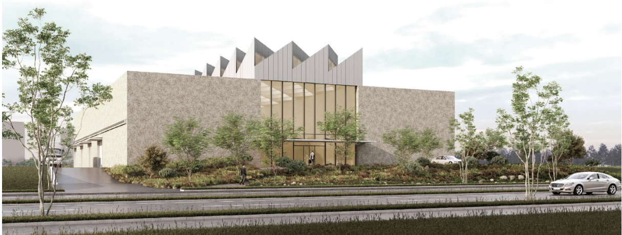
新技術研究所外観イメージ

「探求心・知的好奇心を醸成し次世代の環境と新事業の創出に挑戦する」をビジョンとして推進